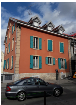
Audincourt «Pasteur »