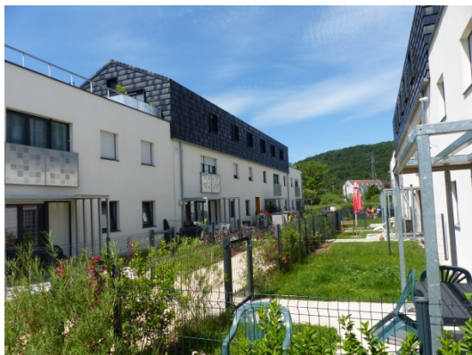
Voujeaucourt « Les Jardins du Moulin »

Ainsi, au 31 décembre 2019, le patrimoine géré est de 3 068 logements, 1 256 garages et parkings sur 26 communes.