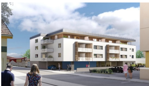
Pontarlier « Saint-Pierre » (perspective)