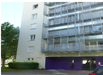
Sochaux, 6 rue des Graviers