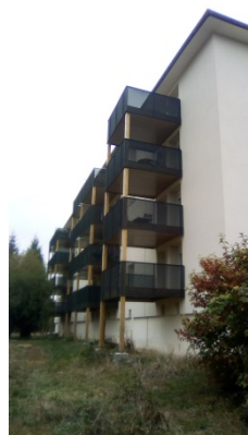
Valentigney « La Novie »