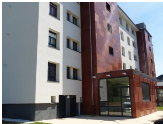
Voujeaucourt « Le Moulin »