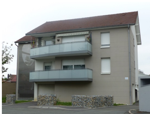
Sochaux « Thévenot»