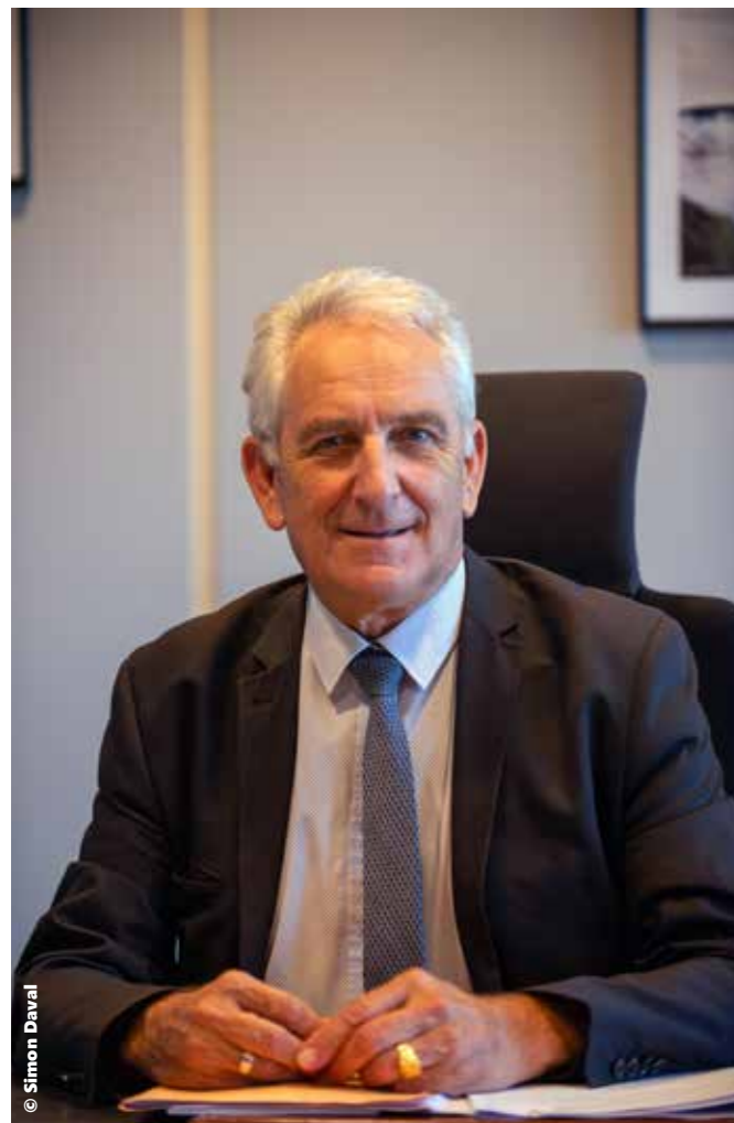
Charles DEMOUGE, Président de Pays de Montbéliard Agglomération

D ès mon premier mandat à la tête de Pays de Montbéliard Agglomération, mon intention d'associer Les élus municipaux de l'agglomération et plus encore de les intégrer aux orientations de PMA souligne ma volonté de rapprocher la Communauté d'Agglomération de ses communes membres.